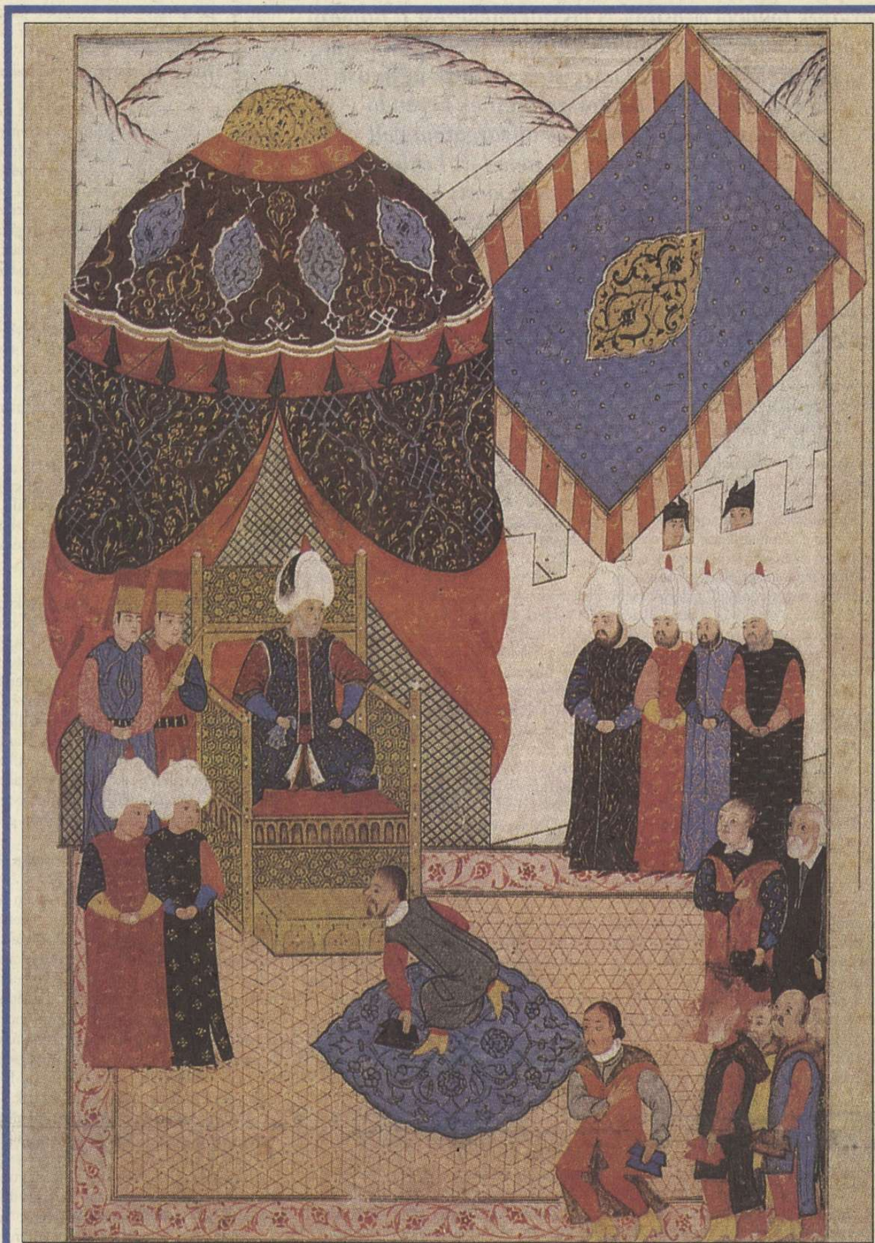
Szulejmán szultán fogadja János Zsigmondot — miniatúra a Magyar Nemzeti Múzeumban 1994. szeptember 7. és 1995. január 8. között látható Nagy Szulejmán szultán és kora című kiállításon (Írásunk a 4. oldalon)